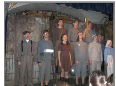
Attēlā fragments no izrādes „Vārnu ielas republika”

Ļoti veiksmīgs ir pats izrādes sākums-izmantojot skolēniem tik zināmās mūsdienu tehnoloģijas-datortehniku, projektoru, parādīt fotoattēlus ar Rīgas objektiem vismaz simts gadu tālā pagātnē, arī tādejādi ļaujot priekšstatīt vidi, kurā risināsies notikumi. Izmantotās dekorācijas ar fotoapdrucku arī rada ļoti ticamu tā laika ainu.