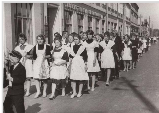
1963. gada 1. septembris

Skolā interesanti bija sadraudzības pasākumi ar Sporta Akadēmijas studentiem. Šie pasākumi bija aizraujoši un interesanti. Vēl ļoti populāri bija pavasara pārgājieni ar nakšņošanu teltīs. Pirms pārgājiena gatavojām putnu būriņus, bet pārgājiena laikā tos pielikām mežā pie kokiem dažādās vietās.