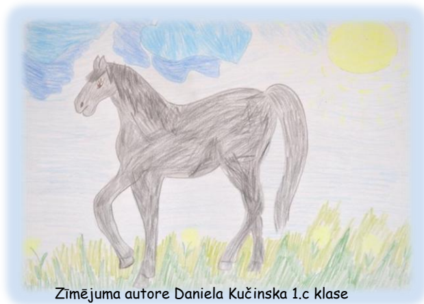
Zīmējuma autore Daniela Kučinska 1.c klase