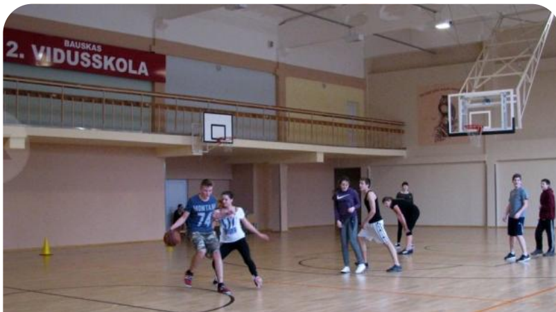
Bauskas 2. vidusskolas rekonstruētā sporta zāle pašlaik ir modernākā novadā.

*Informācija no www.bauskaszive.diena.lv