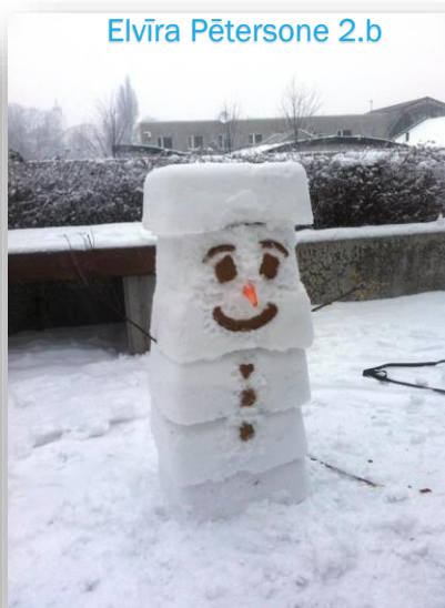
Elvīra Pētersone 2.b