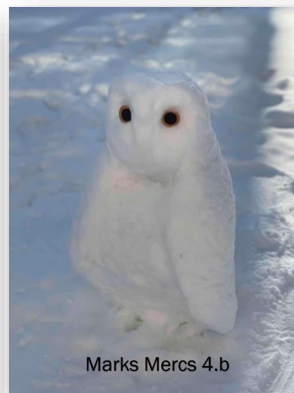
Marks Mercs 4.b