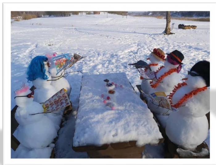
10.a klases kolektīvs