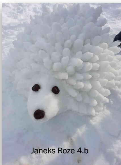
Janeks Roze 4.b