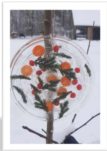
Emīls Eglīte 5.b